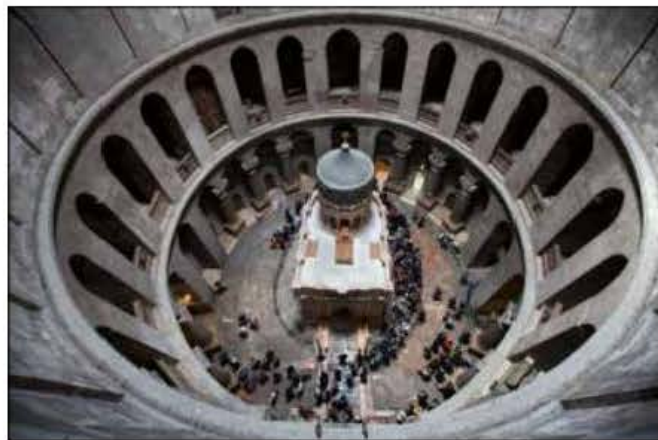
Il-Bażilika tan-Natività f'Betlehem.

Minkejja l-fatt li kien fra lajk, Elija ħalla manuskritt ta' mitt paġna dwar iċ-ċerimonji u l-istatus quo