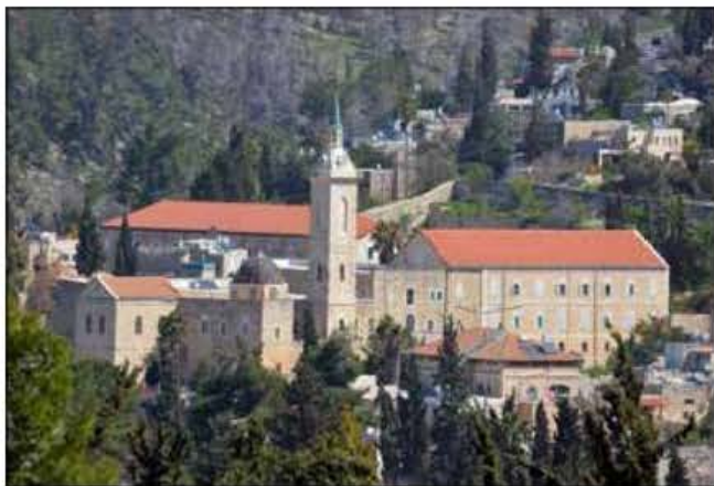
Is-Santwarju tat-Twelid ta' San Ġwann Battista In Montana f'Ain Karem.

Nafu li kien mill-ġdid fil-kunvent ta' Larnaca f'Ċipru (1926-1931), u mbagħad għadda fis-Santwarju ta' Ain Karem (1934-1946). L-aħħar kunvent li kien fih kien dak ta' Ramle (1946-1950).