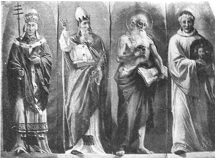
Erbgħa mis-santi padri qabel ma tpoġġew f'posthom madwar it-twieqi

Iżda għalkemm bosta artisti Maltin esperimentaw u wżaw din it-teknika sabiex il-pitturi tagħhom