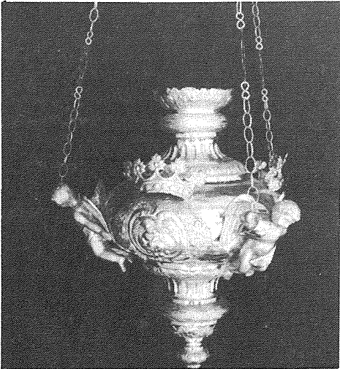
Il-lampier ta' San Ġużepp

Jingħad li kull lampier kien sewa (£60) sittin lira, li għal mitt sena ilu kienet somma ġmiela. Il-piż tal-fidda ta' kull lampier ivarja minn wiehed għal iehor skond id-daqs.