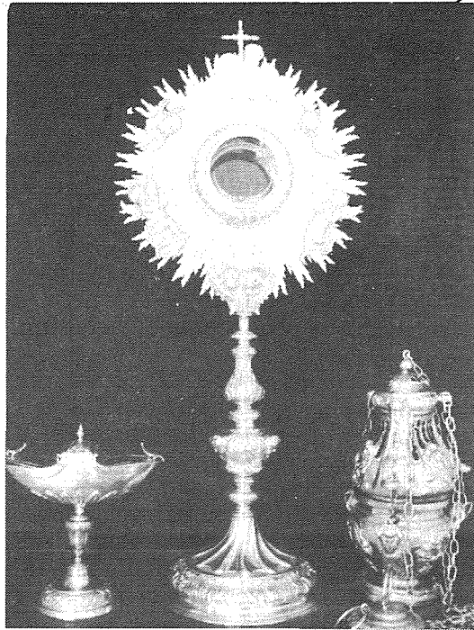
L-isfera u ċ-ċensier

L-isfera tas-Sagrament hija tal-fidda maħduma b'sengha kbira, r-raġġi u sieg huma ornati b'disinn sabiħ hafna.