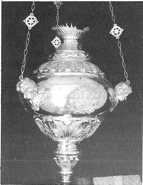
Il-lampier tal-B.V. taċ-Cintura

L-uniku lampier li ma nsteraqx kien dak tal-Madonna tar-Rużarju għaliex kien imdendel għall-festa tal-Madonna tar-Rużarju fix-xahar t'Ottubru. Dan huwa antik fet u dawn Mill-bhom :