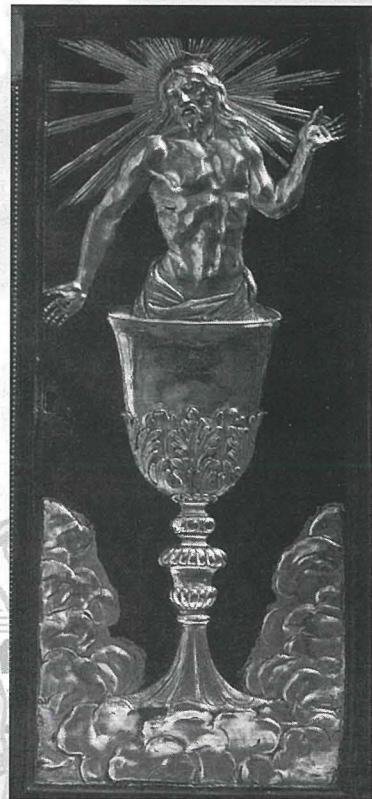
G. Artusu u M. Sprinati - Tabernaklu - bronzindurat - Kunvent ta' Santa Marija ta' Grotta Ferrata.

saħansitra minn artisti prominenti Spanjoli tas-Seklu Sittax bħal Gregorio Fernandez (1576-1636). Ir-Re Filippu III fl-1614 ordna Yacente (hekk kif inhu magħruf bl-ispanjol) minghand Fernandez sabiex jittqiegħed espressament fil-Kunvent tal-Kapuċċini ta' El Prado. Dan ukoll insibuh taħt il-wiċċ ta' l-altar li fuqu ssir il-konsagrazzjoni u kien iċ-ċentru ta' devozzjoni parikolari mhegġa mill-membri tal-kuruna Spanjola. 10