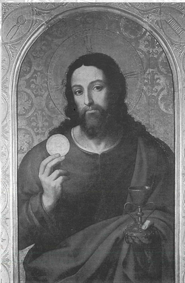
Juan de Juanes (1523-1579) - Kristu Salvatur - Museo de Bellas Artes Valencia.

L-istess hsieb jidher ukoll fil-kwadru titulari tal-Oratorju tas-Sagrament li nsibu maġenb il-knisja parrokkjali. Dawn ideat kellhom iwasslu wkoll għall-glorifikazzjoni tas-Sagrament tal-Ewkaristija f'xoghlijiet oħrajn. Eżempju ta' dawn nistghu nsemmu arazz partikolari mis-sett li l-Gran Mastru Perellos rregala lill-Konkattidral ta' San Ġwann u li juri bl-aktar mod ċar il-glorifikazzjoni tal-knisja li tidher miġbuda fuq karru żżomm f'idejha sfera bis-sagrament ġo fiha; id-