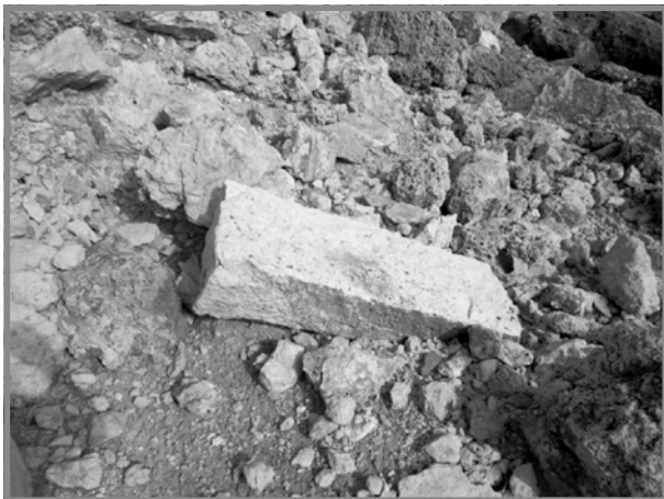
Gēbla maqtugħa u mingura fil- Barriera fl-Irdum ta' Kamiża

Tal-Barkun kienu jrabbu l-fniek fuq il-Blata tal-Fniek . Dawn kienu jithallew jiġru għal rihom