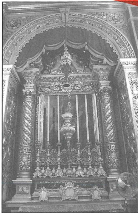
Artal tal-Bon Kunsill

Il-belt ta' Genezzano tinsab xi tliet siegħat