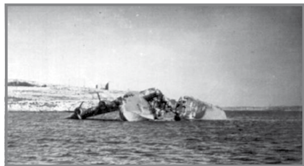
Sunderland L2164 wara li nħaraq u għereq parzjalment.