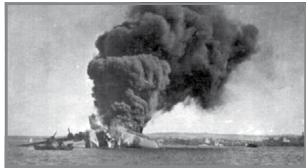
Sunderland L2164 jaqbad.

Gie rrapurtat li waqgħu xi splinters fuq il-Melliċha. 4