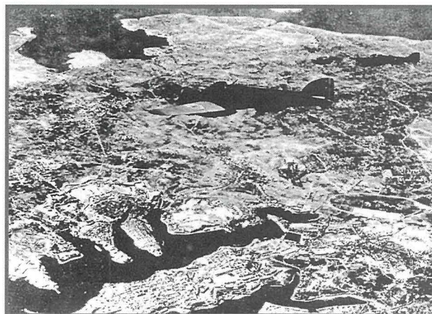
Zewġ bumbardiera Taljani Savoia Marchetti SM79 jittajru fil-gholi fuq il-Port il-Kbir matul wiehed mill-ewwel attakki fuq Malta.