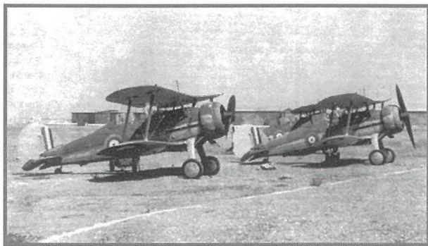
Tliet Gloster Sea Gladiators fl-ajrudrom ta' Hal Far, probabbilment l-istess tlieta li ġew imlaqqa FAITH, HOPE u CHARITY, li ddeffendew lil Malta fl-ewwel granet tal-gwerra.