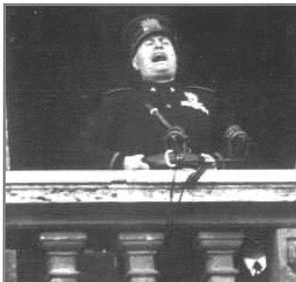
Il Duce Benito Mussolini jiddikkjara gwerra kontra l-Ingilterra u Franza fl-10 ta' Ġunju 1940.

Kulhadd kien jahseb li Franza hija potenza qawwija rigward armata u meta l-forzi Germaniżi bdew javvanzaw sew f'dan il-pajjiz, Mussolini ra li kienet opportunità tajba biex ibil subghajh