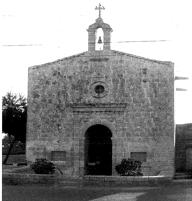
Il-knisja ta' San Klement