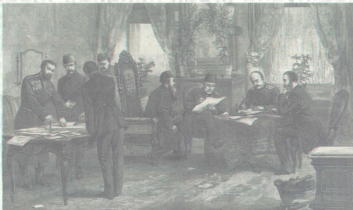
L-iffirmar tat-Trattat ta' San Stefano. Il-jum nazzjonali attwali tal-Bulgarija hu marbut ma' dan l-avveniment

Ta' min isemmi li l-Bulgarija kellha storja pjuttost inqallba, u tissemma għall-ewwel darba bhala stat sovrani lura fis-sena 681, meta twaqqaf dak li llum jirreferu għalih bhala l-ewwel Imperu Bulgaru. Dan l-imperu kien dam sal-1018, meta spiċċa ddominat mill-Imperu Bizantin.