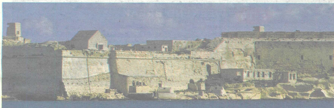
Forti Rikażli li nbriet bejn l-1670 u l-1698 u hi waħda mill-akbar fortizzi f'Malta. F'it aktar minn mitt sena wara, fil-bidu tas-seklu 19, jidher li għamlu żmien jgħixu hemm l-ewwel Bulgari li nafu li kienu hawn Malta