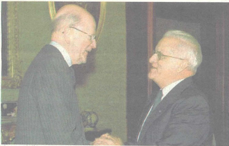
Simeon II tal-Bulgarija meta żar lill-President Eddie Fenech Adami f'Jannar tal-2008