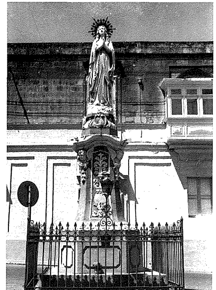
Statwa tal-Madonna ta' Lourdes fi Pjazza f'Hal Qormi

Fil-Malti dan il-hoss ma jeżistix. Naturalment biex wiehed jisima' eżatt dawn il-hsejjes irid jisima' wiehed Franċiż jippronunzjahom.