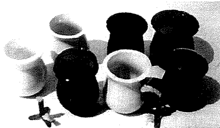
Il-landa li tqattar pitroju jaqbad fuq iċ-ċimblor

tiegħu mħarrġin apposta għal dan ix-xogħol ta' armar. Ngħiduha ċar u tond kien tassew xogħol ta' periklu kbir għall-ħajjet dawn l-irġiel. U graw każijiet fejn waqgħu rġiel minn fuq għal isfel u baqgħu tal-kolp.