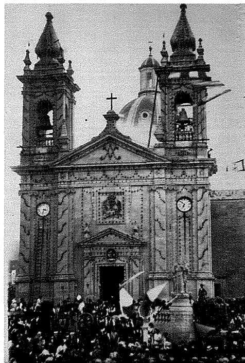
Il-faccata tal-Knisja armata bit-tazzi taż-żejt (1930)

Illum għand xi regattier wieħed forsi għadu jista' jsib xi tazza minn dawn li ktibna dwarhom ta' kuluri u qisien differenti. Fil-knejjes tagħna għad fadal dawk fil-lampieri.