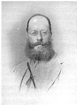
Edward Lear circa 1867

Mingħajr dubju, Edward Lear hu wieħed mill-aktar kittieba umoristiċi, poeti u artisti magħrufa tal-età Vittorjana li qatt żaru lil Malta u Għawdex. Twieled fit-12 ta' Mejju 1812 u miet fid-29 ta' Jannar tal-1888. Għalkemm kiteb bosta kitbiet, fosthom djarji dettaljati tal-postijiet li kien iżur, jibqa' magħruf żgur għall-ktieb tiegħu Book of Nonsense . Lear ma kienx biss kittieb imma wkoll artist magħruf. Biżżejjed ngħidu li għal xi żmien kien jagħti l-lezzjonijiet tal-arti lir-Regina Vittorja nnifisha. Magħruf b'mod speċjali għal xeni rurali tal-postijiet li kien iżur, magħmula l-aktar bit-teknika tal- watercolours .