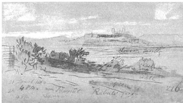
Veduta tar-Rabat minn Ta' Sannat