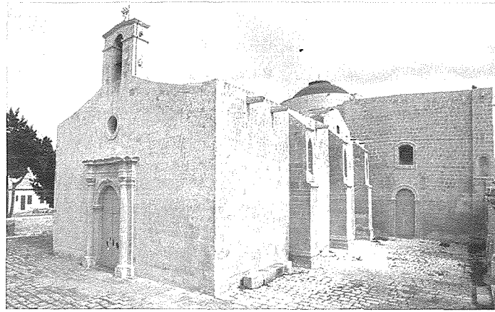
Il-Knisja ta' San Ġirgor - Żejtun