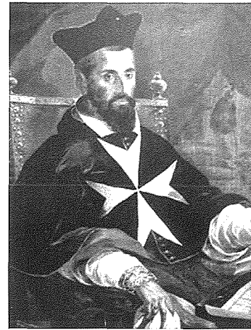
L-Isqof Baldassare Cagliares

Nhar l-10 ta' Jannar 1616, il-parroċċa ta' Santa Katarina taż-Żejtun saret Matrici għall-ewwel darba, meta l-Isqof Bladassare Cagliares waqqaf il-parroċċa ta' Haż-Żabbar li hu fired miż-Żejtun.