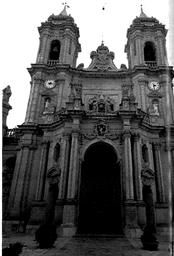
Il-Knisja Parrokkjali ta' Haż-Żabbar, dedikata lil Madonna tal-Grazzja.

Izda minħabba l-bogħod li kellhom għall-knisja parrokkjali (San Girgor) fiż-Żejtun, iż-Żabbarin hassew il-ħtieġa li jsiru parroċċa indipendenti. Numru sewwa minn naha tal-Misraħ kienu sajjieda, tant li fil-bidu tat-triq li tagħti mill-Misraħ għal Wied il-Għajn, kien hemm lokalita' bl-isem 'Has-Sajd'.