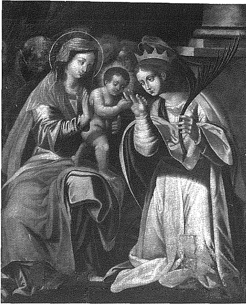
Il-pittura titolari li turi Iż-Żwieġ Mistiku ta' Santa Katerina li illum jinsab fil-mużew parrokkjali.

kampnar ċkejken b'qanpiena wahda) li tinkludi pediment imponenti u li fiha s-sena 1797 imnaqqxa fiċ-ċava, li probabbilment tindika s-sena meta saret, jew meta inbidel il-fontispizju originali, jew inkella meta poggew il-qanpiena fil-post. Il-bieb ewlieni hu rettangolari u hu mżejjen bi gwarniċa u pediment lixx b'tieqa kwadra fuqu. Bejn il-pilastri u l-bieb hemm kwadranti mal-gholi kollu flimkien ma par twieqi fil-baxx, wiehed ma' kull naha tal-bieb. Hemm ukoll bieb f'kull genb tal-knisja. Fuq quddiem hemm zuntier żghir.