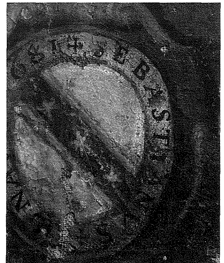
L-arma ġentilizja tal-familja Bonavia flimkien mal-iskrizzjoni 1681 SEBASTIANUS BONAVIDA li tinsab fin-naha t'isfel tal-pittura titolar.

Il-faċċata eleganti fiha pilastru Toskan fuq kull tarf li huma marbutin flimkien permezz ta' gwarniċun li jipproġetta 'l barra u li tahtu hemm l-arma ġentilizja mhassra li diġà semmejnihha. Fin-naha ta' fuq hemm bell-cote (speċi ta'