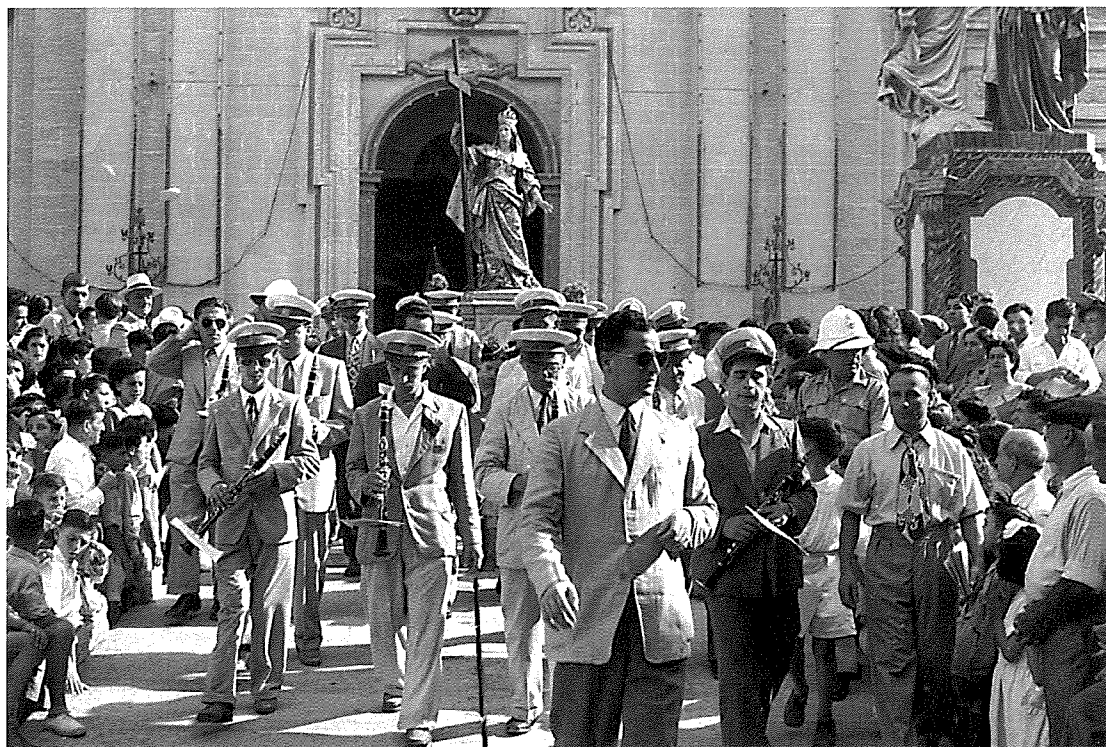
1952: Il-Banda takkumpanja l-istatwa ta' Santa Liena waqt il-purċissjoni tradizzjonali li ssir filgħodu.