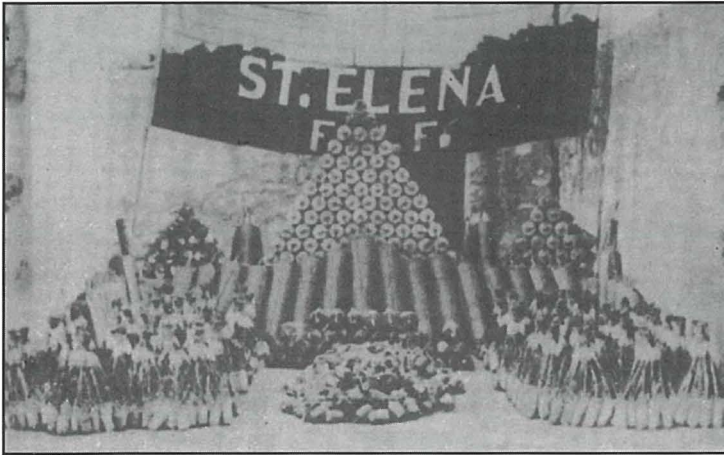
1953: In-nar maħdum għall-Festa ta' Santa liena mill-partitarji tal-Banda taħt id-direzzjoni ta' l-aħwa Briffa.

Fil-festa ta' Sant`Elena tal-1952 is-Socjeta` hadet hsieb tforni l-isparar kollu li nharq matul il-festa. F'Mejju tal-1994, għamli zjara statli f'Malta il-maesta tagħha r-Reġina Elizabetta II u d-Duka ta' Edinburgh. Il-banda tagħna kienet wahda mill-ftit baned li ġew magħżula mill-Kumitat tul festi statali billi laqgħathom fi Triq il-Wied bid-daqq tal-'God Save the Queen'.