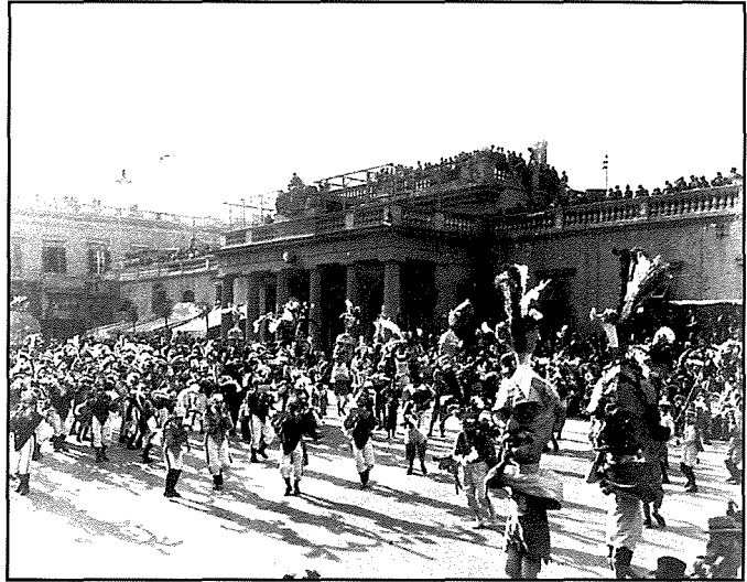
1934: il-Banda bil-Kostum fil-karnival ▶