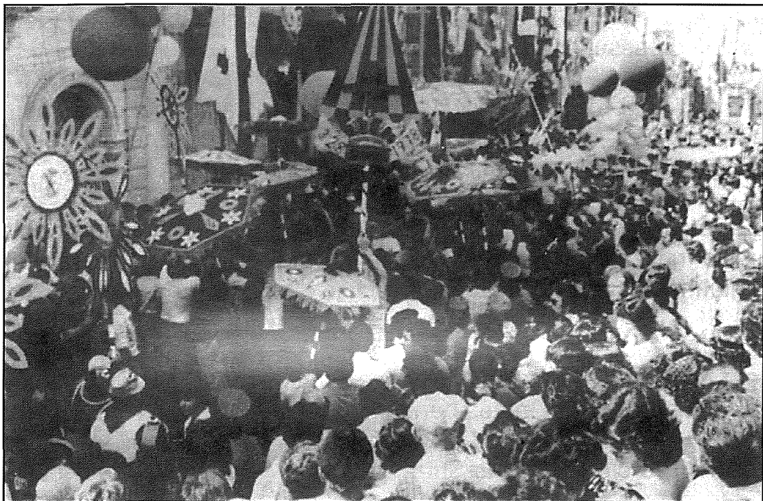
1978: Il-Bidu tal-marċ speċjali li sar f' Jum il-festa filgħodu fl-okkażjoni tal-festi ċinkwantinarji ta' santa Liena.

Is-sena 1995 kienet is-sena 130 mit-twaqqif tal-Banda kif ukoll 5 Snin tal-Kumitat Żgħażaġh. Biex jiftakkar