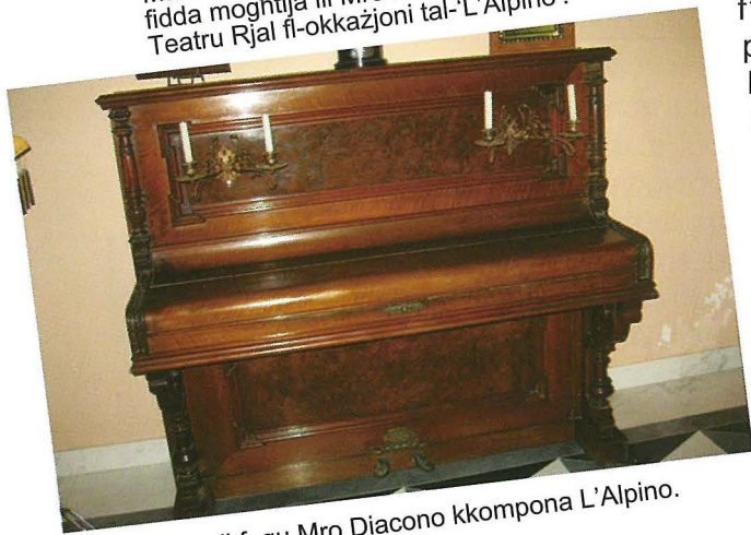
Piano li fuqu Mro Diacono kkompona L'Alpino.

Dan kollu jghin biex l-effet tal-kor, solisti orkestra fl-aħħar tutti jasal bħala moment ta' katarsis wara tant turbulenzji li ppreċedew.