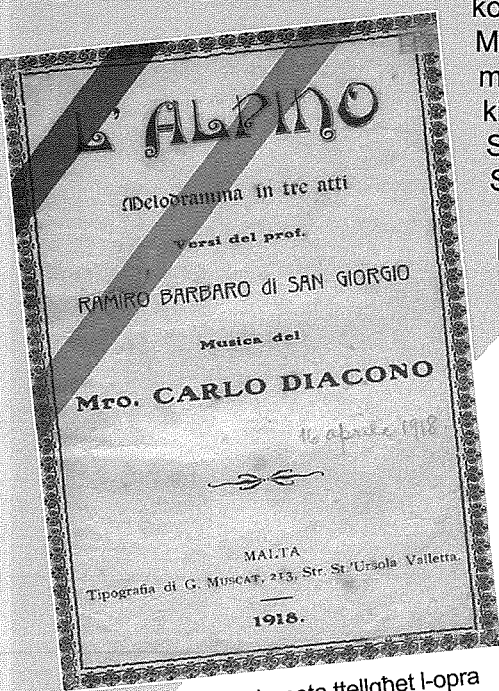
Qoxra tal-ktejjeb meta tteggħet l-opra fit-Teatru Rjal f'April 1918.