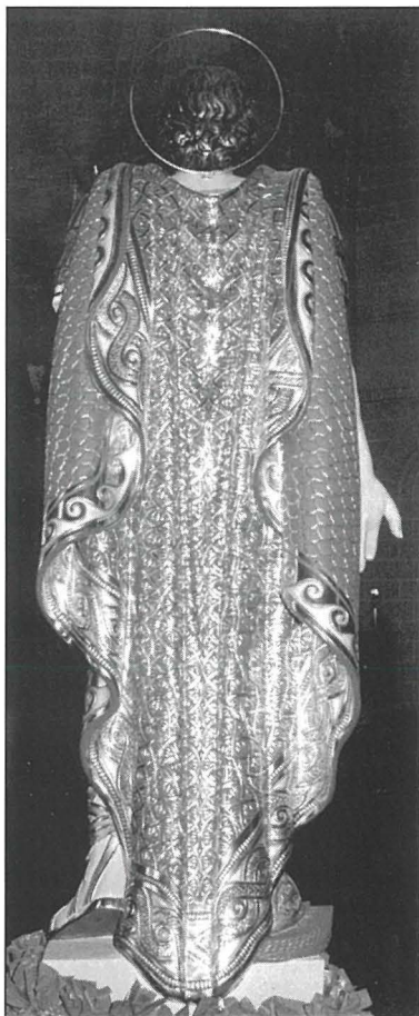
Dettal tad-disinji fuq il-mant tal-vara titolari.

Xoghlijiet ohra msawra minn idejn l-istess skultur għall-knisja ta' San Bastjan, jinkludu d-disinji għall-induratura ta' l-istatwa titolari ta' San Bastjan. Dawn huma mnebbha mill-możajċi, pavimenti, u affreski Romani