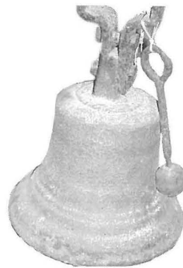
Qanpiena antika li kienet maħsuba biex tiddendel fiċ-ċimiterju tal-parroċċa