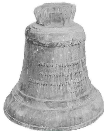
Il-qanpiena ta' Paccard illum tinsab miġbura fid-dar tal-Arċipret.

preżenti fil-kampnar meta l-espert tad-ditta Paccard, b'mazza tal-injam f'idu, daqq il-qniepen. Hekk l-espert ikkonkluda li t-ton tal-qanpiena l-ġdida kellu jkun 'Mi naturale'. Biex b'hekk tintona tajjeb ħafna mal-bqija tal-qniepen l-oħra. Meta mbagħad waslet, il-qanpiena kienet tagħmel akkordju perfett maż-żewġ qniepen iż-żgħar li kien hemm fil-kampnar. Din il-qanpiena swiet madwar elf u ħames mit lira Maltin (€3494) u tħallset mill-ġbir tal-poplu. Tizen żewġ qnatar (160 kilo). Waslet Għawdex f'Awwissu tal-1984, l-istess sena li fiha ġiet ordnata. Waslet ġo kaxxa tal-injam akkumpanjata minn espert tad-ditta Nani. X'hin waslet ta' Sannat, iddaħħlet fil-knisja fejn ġiet miftuħa l-kaxxa biex il-qanpiena setgħet tinħareġ. Hawnhekk l-espert tad-ditta Nani kien pront idoqq il-qanpiena b'mazza tal-injam li kellu f'idu u dlonk ikkonferma li t-tonalita tagħha kienet 'Mi Naturale'