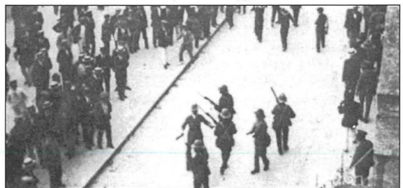
Soldati Ingliżi jirtiraw lejn il-Qorti wara li fetħu n-nar fuq il-folla