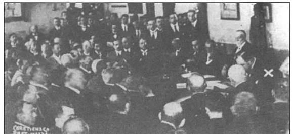
L-Assemblea Nazzjonali tiltaqa' fil-Giovine Malta taht il-Presidenza ta' Filippo Sceberras

Il-Maltin kien ilhom jingħataw il-ġenb mill-amministrazzjoni Ingliża f'Malta u b'hekk f'sitwazzjoni ta' faqar kbir, amministrazzjoni minn