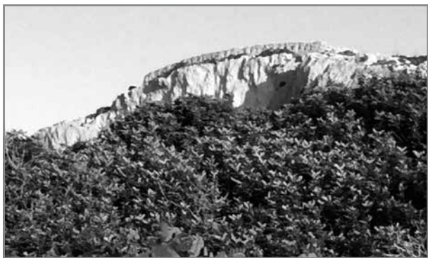
Il-ħajt ta' difiża ta' Qasam Barrani fuq ir-riħ tal-Bajja tal-Għadira

rapporti simili kienu qed jaslu mill-inħawi tal-kosta tal-Mellieħa fuq sottomarini tal-għadu.