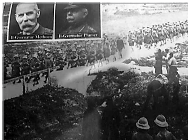
Soldati mis-Sutherland and Argyll Highlanders jieħdu sehem f'manuvri qrib il-Bajja tal-Għadira, ftit żmien qabel il-Gwerra tal-1914-1918. Fl-isfond jidhru ritratti tal-Gvernturi Methuen (1915-1919) u Plumer (1919-1924)

sistema ma taħdimx u fl-1907 reġgħet saret priorità l-ħarsien tax-xtajtiet tat-tramuntana u bdiet ħidma biex tinbena sistema ġdida ta' trunċieri u kanuni magħrufa aħjar bħala ridge defences . Dan fl-inħawi tagħna saru l-aktar fuq l-għoljiet tal-Mellieħa fuq ir-riħ tal-bajja tal-Għadira 37 .