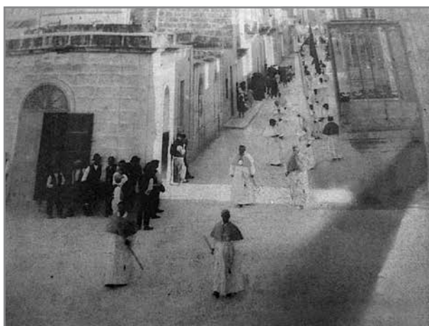
Id-daħla tal-Pjazza tal-Mellieħa fl-1907