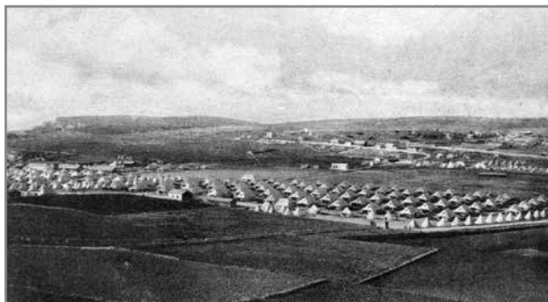
Il-Kamp ta' Għajn Tuffieħa fl-Ewwel Gwerra Dinjija

Dan il-post jaf l-origini tiegħu mill-1902 'il quddiem fejn l-Ammiraljat kien ħa numru ta' art agrikola mingħand il-bdiewa biex inbena kamp ta-taħriġ għall-morini. Dan kien jikkonsisti f' ranges tal-isparar u kwartier residenzjali għas-soldati, il-familji tagħhom u l-uffiċjali tal-kamp.