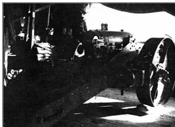
Kanun tat-tip 4.7 inch

F'dan iż-żmien, il-Militar beda jieħu xi artijiet bħal f'Għajn Tuffieħa biex jagħmel dawn ir- ridge defences . L-aktar sistema ta' difiża simili bikrija li nsibu hija dik ta' Qasam Barrani li saret fl-1903 u fl-1904 saret sistema oħra bħala, wara l-Knisja Parrokkjali u f'Ta' Sellum fuq ir-riħ tal-Bajja tal-Għadira 38 fejn fl-istess post fl-1910 kienu ġew installatti żewġ kanuni tat-tip 4.7-inch u 15-pdr 39 .