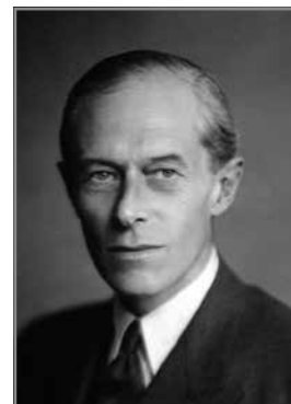
Sir Gerald Creasy

Fid-29 ta' Mejju 1950 il-Kazin Imperial gie onorat biż-żjara tal-Eċċellenza Tiegħu l-Gvernatur Sir Gerald Creasy u s-Sinjura tiegħu, flimkien mal-Kappillan tal-Mellieħa u l-Kleru tal-Parroċċa. L-Onorabbli Joseph Schembri talab lill-Kumitat Imperial biex jorganizza ċelebrazzjoni ad unur tiegħu fl-okkażjoni tal-ħatra tiegħu bħala President Onoraru tal-Kumitat tal-Kazin u din saret nhar il-31 ta' Awwissu 1950 fejn hu mbagħad ipprezenta standard lill-Kazin.