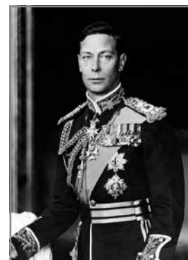
Re Ġorġ VI

Is-sena 1937 tibqa' mfakkra l-izjed fil-Kazin għax il-Banda Imperial ġiet mistiedna biex tieħu sehem fiċ-ċelebrazzjonijiet li saru fil-Belt Valletta nhar il-15 ta' Mejju 1937 b'kommemorazzjoni tal-Inkurunazzjoni tar-Re Ġorġ VI tal-Ingilterra. Dan