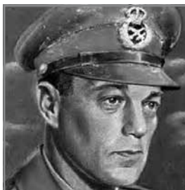
Sir Robert Laycock

Fil-bidu kien gie deċiż li l-25 Anniversarju tal-Każin Imperial jiġi ċelebrat nhar it-28 ta' Awwissu 1955, imma din id-data giet mibdula aktar tard għat-18 ta' Settembru 1955. Giet imwaqqfa kummissjoni ta' erba' membri, inkluz is-Surmast tal-Banda, biex torganizza dan l-avveniment u biex thejji programm għall-Banda. Għal din l-okkażjoni gie deċiż li jiġu mistiedna l-Eċċellenza Tiegħu l-Gvernatur Sir Robert Laycock, l-Arcisqof Mikiel Gonzi, il-Prim Ministru Dom Mintoff u persuni prominenti oħra. Għal din l-okkażjoni gie kummissjonat ukoll Stendard Malti bil-George Cross fih u dan kien se jsir għand is-Sorijiet tal-Qalb ta' Ġesù tal-Mellieħa.