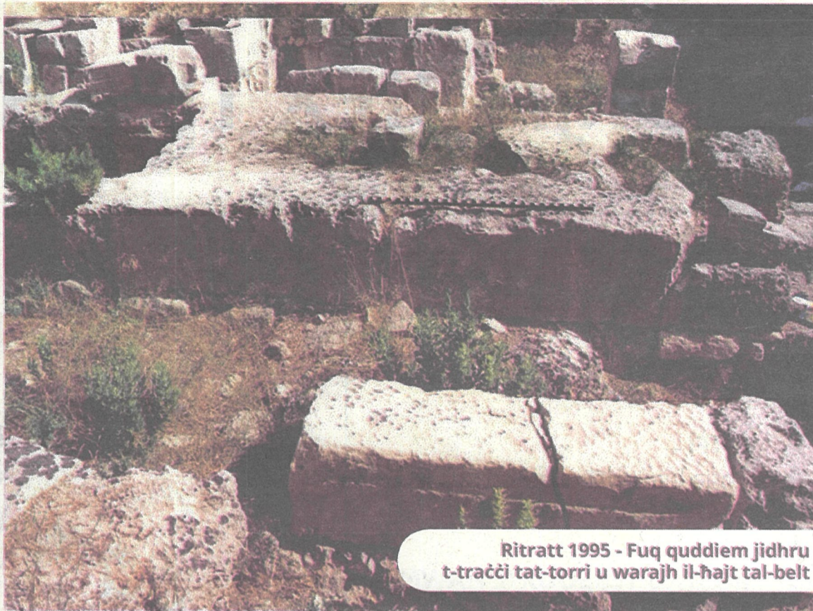
Ritratt 1995 - Fuq quddiem jidhru t-traċċi tat-torri u warajh il-hajt tal-belt

Il-pedament tal-bieb u s-swar tal-belt huma mibnija fuq 3 sa 4 metri blat, li jistrieħ fuq madwar 12-il metru (40 pied) ta' tafal. Il-ħxuna tal-blatt, minkejja li kienet ta' spessur ridott kienet