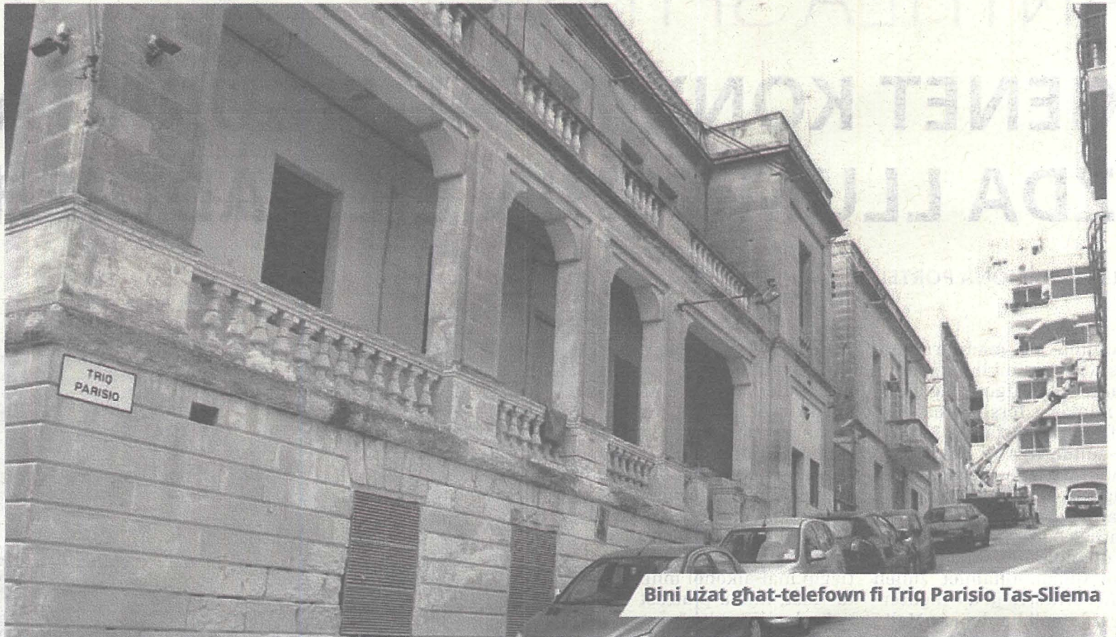
Bini użat għat-telefown fi Triq Parisio Tas-Sliema

L-ewwel Exchange kien dak fi Spencer Hill, Blata l-Bajda b'kapacità ta' 7,000 linja mill-Kumpanija Standard & Telephone Co, Uk., sistema Strowger. Dan kien inawgurat fis-26 ta' Ottubru 1957. Wara daħal l-Exchange ta' Tas-Sliema u gie inawgurat fit-30 ta' Marzu tal-1963. Fl-istess sena daħlu fis-servizz erba' Exchanges awtomatiċi, li kienu Satellite Exchanges, jew Remote Exchanges, li kienu: fix-Xemxija; fil-Bajja s-Sabiha