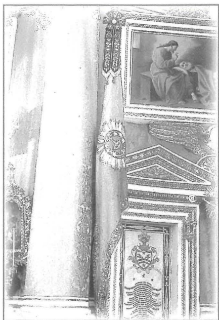
Listandart ikhal tal-Fratellanza ta' San Ġuzepp magħruf għas-sbuhija tiegħu.

Twaqqfet fuq l-artal li kien originarjament iddedikat lil Sant' Anna. Qabel it-twaqqif tal-Fratellanza tbiddel il-kwadru ta' Sant' Anna ma' dak li għadna ngawduh sal-lum ġewwa r-Rotunda li huwa xogħol mill-isbaħ tal-pittur magħruf Malti Stefano Erardi (1630-1716). Wisq probabbli li Erardi ta importanza lil Sant' Anna fil-kwadru tiegħu b'tifkira tal-kwadru l-qadim f'ġieħ din il-qaddisa li kellha artal fil-knisja parrokkjali l-qadima li kellna. Il-purċissjoni bl-istatwa (l-istess waħda tar-Rużarju) kienet issir fl-ewwel Hadd fuq it-28 ta' Awissu, festa ta' Santu Wistin.