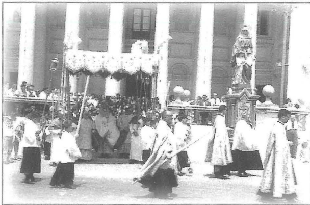
Dehra ta' l-aħhar purċissjoni "Tat-Terza" ta' nhar Santa Marija. Il-Hadd, 15 ta' Awissu 1965

Kienu d-Dumnikani li lejn it-tieni nofs tas-seklu sittax taw spinta kbira 'l quddiem bid-devozzjoni tar-Rużarju Mqaddes. Kien għalhekk li fil-parroċċi tagħna bdew jitwaqqfu, waħda wara l-oħra, il-fratellanzi 'tar-Rużarju', bil-ħsieb li l-imseħbin jgħidu iżjed ir-Rużarju.