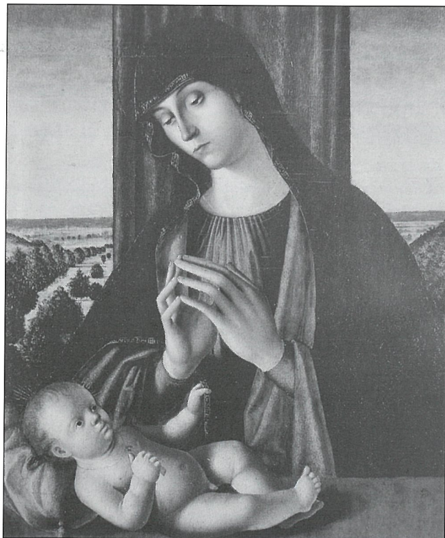
Il-Pittura ta' de Saliba li tinsab fil-Mużew Jacquemart-André f'Parigi

Grazzi għal dan ix-xogħol ta' konservazzjoni u restawr reġġu haġu l-kwalitajiet oriġinali u ta' livell għoli li kien hemm moħbija bl-intervent li kien għamel Villavicentio. Imma mhux biss, din il-pittura, bl-istorja affaxxinanti tagħha, reġġet tpoġġiet fil-kuntest storiku tal-arti li jixirqilha. B'hekk stajna niskopru teżor ieħor importanti li jagħmel parti mhux biss mill-wirt taż-Żejtun imma tal-istorja tal-arti tal-gzejjer tagħna.