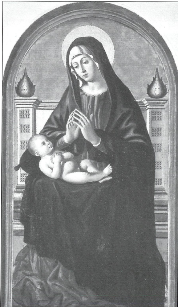
Il-Pittura li tinsab fil-Mużew tal-Parroċċa

Il-pittura tal-Verġni Marija bilqiegħda fuq tron b'Ġesù tarbija f'hoġorha li qiegħda fil-Mużew tal-Istorja u Arti tal-parroċċa taż-Żejtun (u li kopja tagħha tinsab fuq l-artal tar-Rużarju fil-knisja tal-istess parroċċa) hija waħda mill-ftit pitturi li għad fadal ta' żmien il-bidu tar-Rinaxximent f'Malta. Bħala xbieha jidher li kienet meqjuma ħafna. Xhieda tal-importanza li għandha huwa l-fatt li jeżistu mill-inqas tliet kopji tagħha, wieħed minnhom żejt fuq it-tila li jiffirma parti mill-kollezzjoni li hemm fil-Palazz Verdala, il-Buskett.