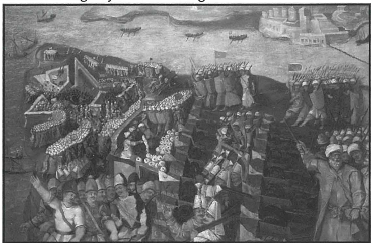
Il-waqgħa ta' Sant Iermu - pittura ta' Matteo Perez d'Aleccio ġewwa l-Palazz il-Belt

Fl-Assedju l-Kbir ta' Malta, li din is-sena qed nikkomemoraw l-450 sena minn mindu seħħ, il-ġlieda għal Forti Sant Iermu kienet waħda kruċjali. Għall-Kavallieri ta' Malta u għall-Maltin, it-telfa ta' din il-fortizza, eżattament fit-23 ta' Ġunju 1565 lejliet il-festa ta' San Ġwann, kienet waħda kerha u l-ewwel telfa sinjifikanti f'din it-taqbida. Biss, id-dewmien biex tintrebaħ din il-fortizza għamel ħafna aktar ħsara lit-Torok li ħlew ħafna mir-rizorsi u l-ħin li kellhom fuq din il-fortizza tant li din kienet waħda mir-raġunijiet tat-telfa tagħhom.