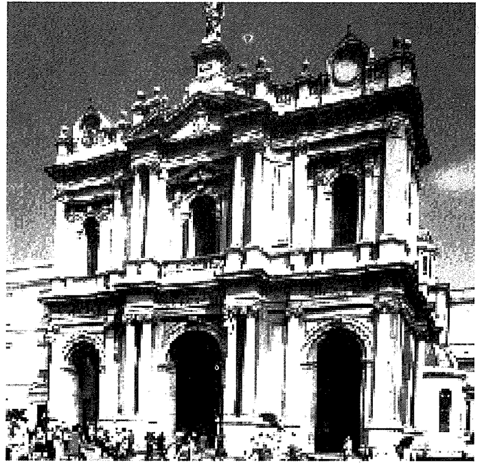
Is-Santwarju tal-Madonna ta' Pompei gewwa l-Italja

ghall-ewwel darba l-perjodiku 'Il Rosario e la Madonna di Pompei' u l-Papa Ljun XII bierku. Fil-perjodiku kienu jingabru xi grazzji u xi fatti straordinarji mwettqa bl-intercessjoni tal-Madonna ta' Pompei.