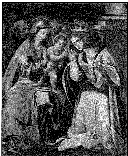
Il-pittura titolari li turi Iż-Żwieġ Mistiku ta' Santa Katerina li llum jinsab fil-mużew parrokkjali.

u jkabbru l-artal titolari għax kien dejjaq. Skont il-Vista Pastorali tal-istess Isqof Gargallo fl-1598, il-Kappillan ta' Hal Qormi kien jiċċelebra l-festa ta' Santa Katerina bil-kant tal-primi vespri u l-quddiesa. In-nies devoti tal-inhawi kienu jixghelu l-lampier kull nhar ta' Sibt u jiehd u hsieb tal-kappella. Ghalkemm ma kienx hemm gandlieri fil-kappella, kien hemm in-necessitajiet l-oħra kollha flimkien ma pittura titolari sabiha ( isejhlha iconam decentem ) flimkien ma ventartal tad-drapp.