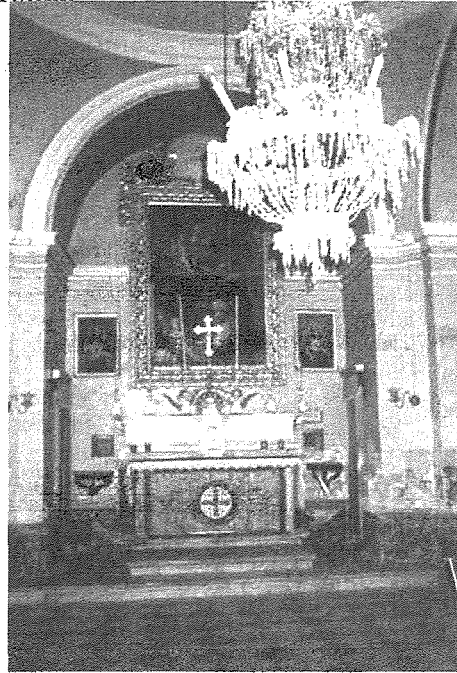
Kappella ta' San Pietru (Dumnikan Martri)

Martri (xogħol Baskal Buhagiar), iehor lill-Madonna tal-Karmnu u iehor lir-Redentur (xogħol Ġużeppi d'Arena). Insibu wkoll statwa mdaqqa ta' Sant'Anna li saret ġewwa Franza. Din il-kappella hija ġuspatronat.