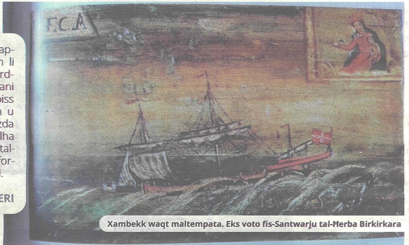
Xambekk waqt maltempata. Eks voto fis-Santwarju tal-Ħerba Birkirkara