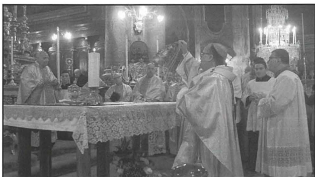
Pontifikal Festa San Pawl Nawfragu l-Belt