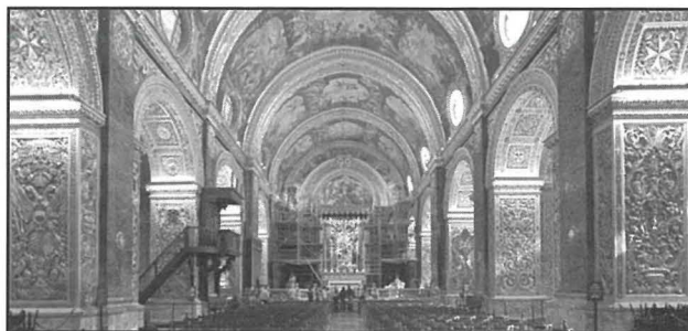
Il-Katedral ta' San Ġwann, il-Belt Valletta