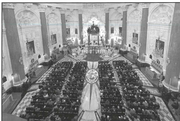
Bażilika Santwarju tal-Madonna tal-Karmnu Valletta