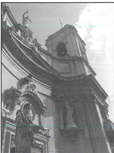
Knisja Bażilika Porto Salvo u San Duminku l-Belt