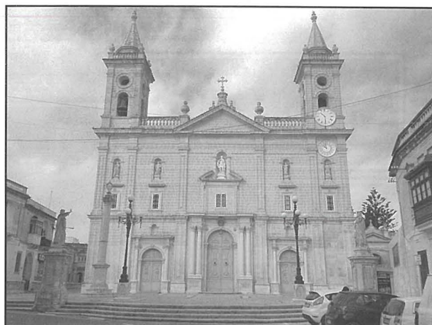
Il-Knisja ta' San Ġorġ, Ħal Qormi

Għalhekk inħoss li l-parroċċa ta' San Ġorġ Martri, li hu mhux biss matriċi u arċimatriċi iżda omm it-tixrid tal-fidi Nisranija, mhux biss il-belt kapitali iżda f'diversi lokalitajiet, għandha ssir bażilika.