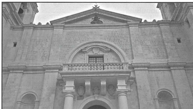
Il-Katedral ta' San Ġwann

Awguri lill-Għaqdiet sportivi, u persuni individwali Qriema, li għamlu suċċess f'dan l-istaġun sportiv