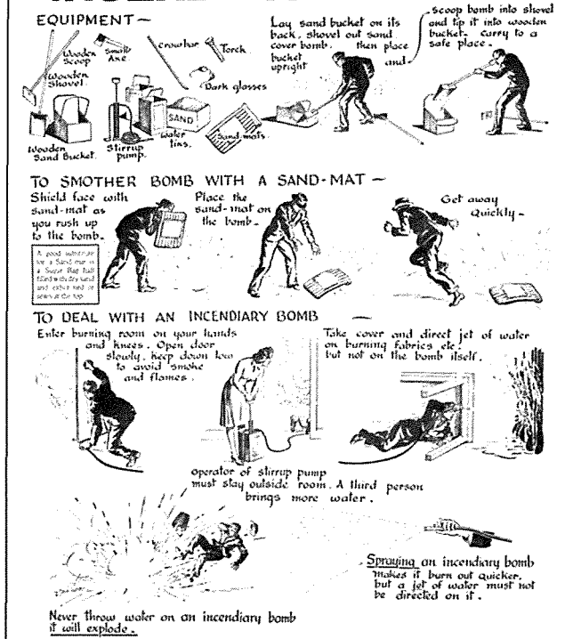
Poster li juri kif ghandek titfi bomba 'incendiary'