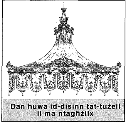
Dan huwa id-disinn tat-tużell li ma ntagħzilx

Mużew Parrokkjali. Il-fatt li ma ntagħzilx ma jfissirx li mhux sabih jew artistiku. Meta tqabblu mad-disinn li ntagħzel, jidher li hu aktar sempliċi u żnell , iżda għandu wkoll il-hafna preġji tiegħu. Żgur li xogħol ta' injam, u skultura fl-injam, kien ikollu hafna anqas min dak li sar, iżda hu helu hafna fil-linji dritti tiegħu. Żgur ukoll li ma kienx se jagħti idea ta' toqol u peżantezza li forsi jagħti dak li ntagħzel. Id-disinn tar-rakkmu fil-patalotti hu kollu l-istess, b'eccezzjoni ċkejna fil-patalott tan-nofs, fejn kellha ssir l-arma ta' Santa Katarina, iżda għal darb' oħra kienet se tkun aktar sempliċi minn dik li għandu t-tużell tal-lum, peress li r-rotta kienet se tkun nieqsa. Barra minn hekk, dan id-disinn tal-patalotti kien se jkun fih innifsu wisq anqas elabora minn dak li naraw illum. Il-palma tal-martirju ma kenitx se tkun irrakkmata fuq il-bellus, iżda skolpita fl-injam tal-gwarniċ. Ukoll il-fjokk, li minnu jiddendel it-tużell, kien se jkun bil-bosta aktar sempliċi minn dak li sar. Fuq nett kien se jspiċċa bil-kuruna ta' Santa Katarina.