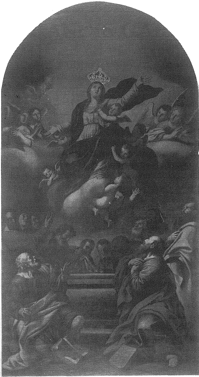
Il-kwadru ta' l-Assunta ta' Baskal Buhagiar, kif jidher illum fir-Rotunda, wara r-restawr ta' l-1975 minn Maurice Cordina