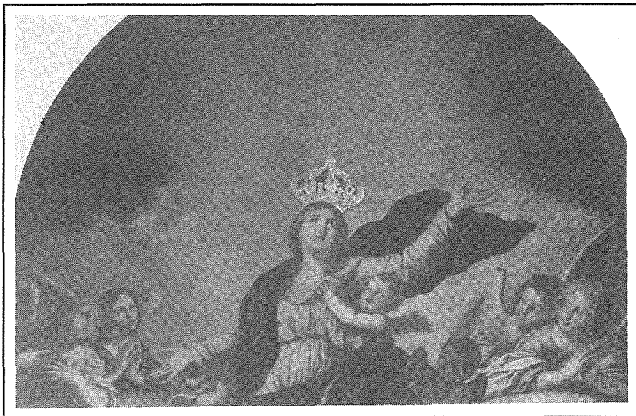
Iż-żjieda 'il fuq minn Ras il-Verġni. B'din iż-żjieda tbiddlet il-forma oriġinali tal-kwadru li minn rettangolari saret waħda b'nofs ċirku fuq nett.