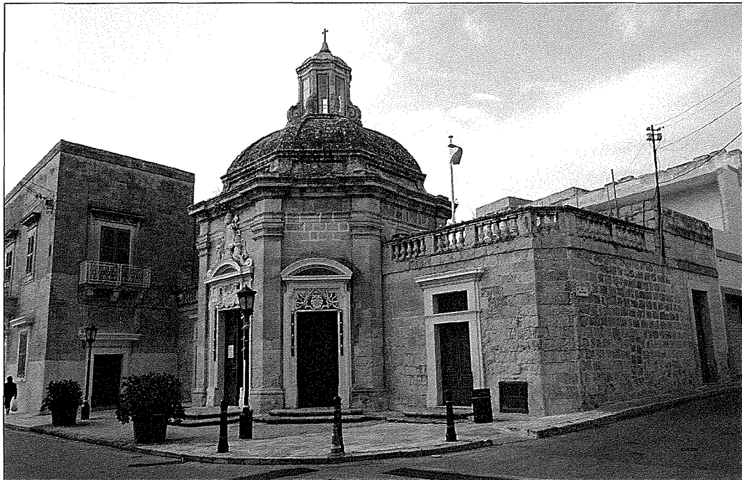
Kappella tad-Duluri - Haż-Żebbuġ

passjoni ta' Ġesù Kristu u l-ġimġha ta' qabel Hadd il-Palm kienu johorġu l-istatwa tad-Duluri. Dawn il-purċissjonijiet kienu jsiru żgur qabel l-1759 peress li jissemmew fil-Viżta Pastorali li l-Isqof Rull kien għamel.