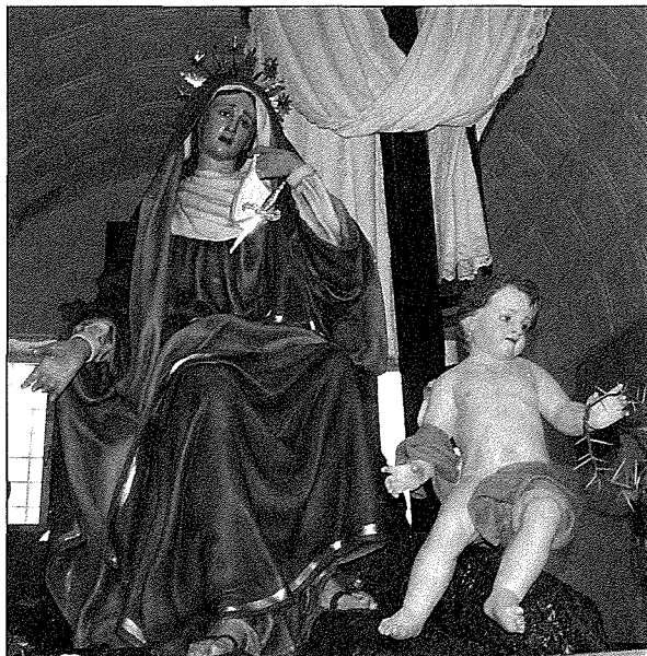
Statwa tad-Duluri - Tal-Pieta

Madonna tad-Duluri. Kien propju minn din il-kappella li din il-lokalità ħadet l-isem tagħha. Dak iż-żmien l-Isqof kien ħalla din il-knisja f'idejn il-Patrijiet Agostinjani, imma aktar tard minħabba