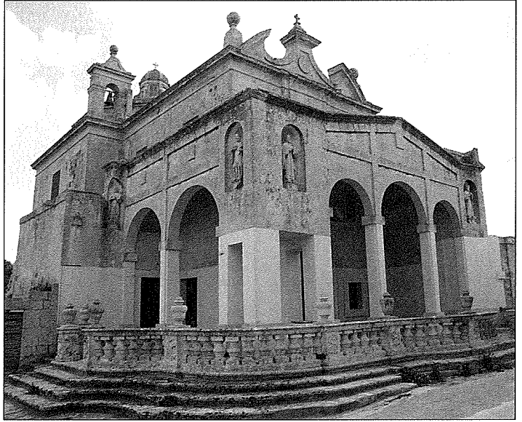
Knisja tal-Ħniena - Il-Qrendi

Halli nsemmi ftit avvenimenti li forsi mhux kulhadd sema' bihom. Bejn is-sena 1467-1470 kien hawn nuqqas ta' xita u nixfa kbira li għamlet ħsarat kbar. Il-Maltin daru lejn il-Madonna tal-Mellieha talbu bil-qalb u niżlet xita bl-abbundanza. L-istess kien ġara 1640 waqt nixfa