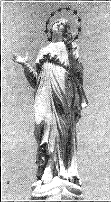
Santa Marija ta' fuq iz-zuntier tar-Rotunda, maħduma fil-konkrit.

I-anġlu kbir?" qalli b'herqa b'ghajnejh f'ghajnejja.