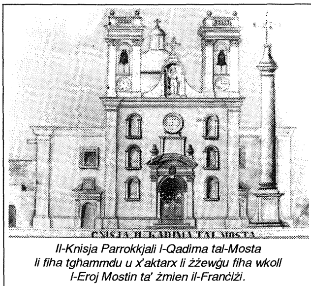
Il-Knisja Parrokkjali l-Qadima tal-Mosta li fiha tghammedu u x'aktarx li żżewġu fiha wkoll l-Eroj Mostin ta' żmien il-Frañċiżi.

min kienu dawn is-sittax-il suldat tal-Battaljun tal-Mosta li dwarhom jgħid hekk bejn wieħed u iehor: