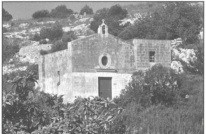
Il-Kappella ta' Sant Anna