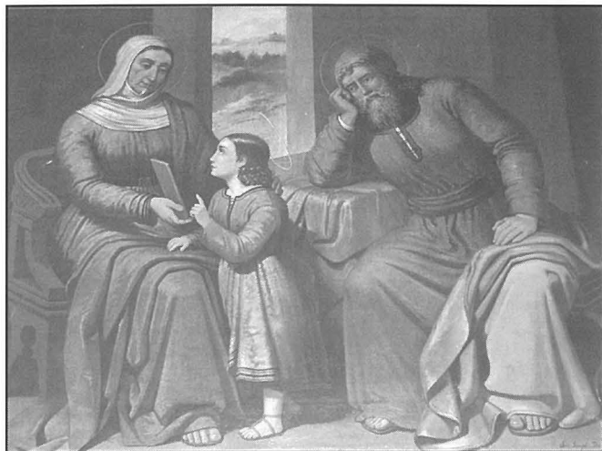
Il-kwadru titulari preżenti

Ftit li xejn nafu dwar il-kappella matul is-seklu dsatax, imma skont bdiewa li minn dejjem kellhom il-familji taghhom jghixu fl-inhawwi, meta bdiet tintuza fl-ewwel kwart tas-seklu li għadda, ma tantx kienet fi stat tajjeb u kienu saru diversi xogħolijiet strutturali fiha, fosthom il-bdil tas-saqaf minhabba l-ħsarat li kellu. Għalkemm għadni ma għamiltx ricerka dwar kif il-benefikat li kien twaqqaf fl-1672, għadda minn id għall-oħra jew inkella giex ċedut lill-Knisja Maltija matul l-ewwel snin tas-seklu l-ieħor, din il-kappella bdew