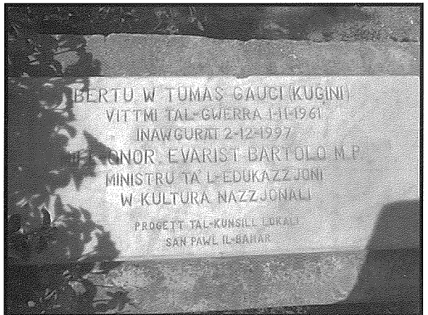
Irħama kommemorattiva li tfakkar l-inawgurazzjoni ta' Ġnien Bertu u Tumas Gauci – 2/12/1997