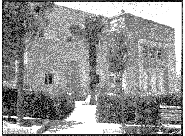
Ġnien Bertu u Tumas quddiem l-entrata prinċipali tal-Iskola Primarja.

Nappella wkoll sabiex tingabar l-istorja ta' San Pawl il-Baħar tul it-Tieni Gwerra Dinjija, sabiex din l-informazzjoni ma tintilifx.