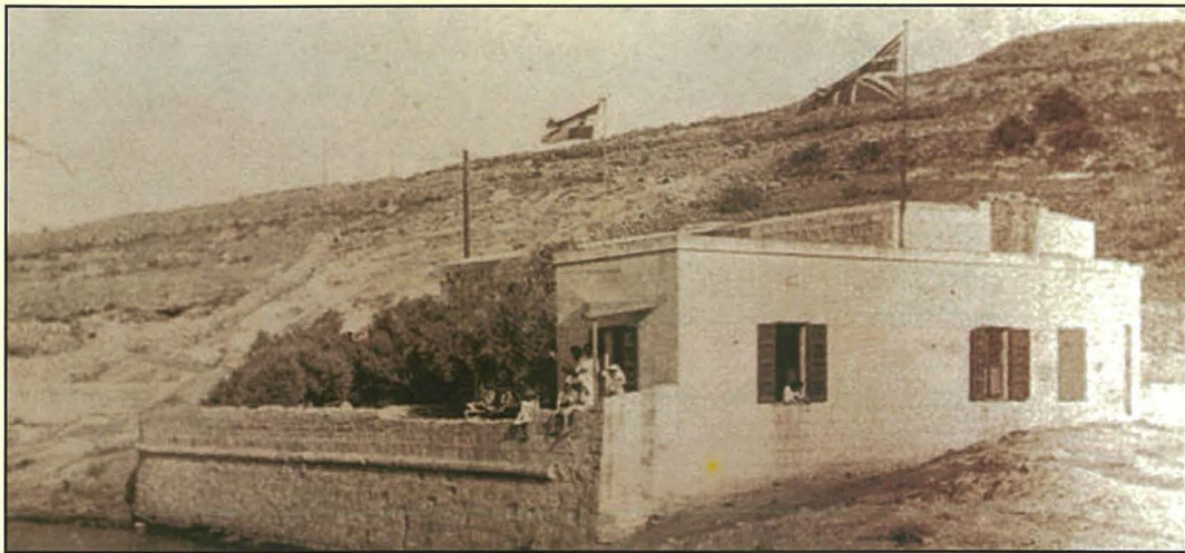
Ir-Ritdott tad-Dellija li nħatt biex twessgħet it-triq

kontra l-ħakkiema tagħhom u rnexxielhom isakkruhom wara s-swar tal-Belt Valletta u l-Kottonera. L-istess swar li nbnew biex jiddefendu l-Maltin, issa kienu qed jintużaw kontrihom. Il-Maltin mill-ewwel għarfu li waħedhom ma' setgħux ivinċu u għalhekk għamlu talba lil Viċi Re ta' Sqallija. Dan minn naħa tiegħu talab sabiex il-qawwa Navali Ingliża tintervjeni. Kienu fil-fatt il-Portugizi li waslu l-ewwel u taw l-ewwel għajnuna imma dan qajla jissemma. L-Ingliži bdew jaslu f'Malta fl-1799 u l-port ta' San Pawl il-Baħar, minħabba li kien distanti mill-Belt Valletta u l-Kottonera, lagħab parti mportanti biex jitniżlu t-truppi f'dawn l-inħawwi. Fil-fatt nhar l-10 ta' Diċembru 1799, it-30th Cambridgeshire Regiment , magħmul minn 32 uffiċċjal, 37 surgent, 409 suldat, akkumpanjati minn 20 mara u 15 tfal, waslu Malta minn Messina fuq l-HMS Culluden. It-truppi żbarkaw f'San Pawl il-Baħar u mmarrċjaw lejn Birkirkara fejn ingħaqdu mall-kumpaniji Maltin. Eżempju ieħor kien meta fl-4 ta' Lulju 1800 l-HMS Stately u l-HMS Niger dahlu fil-port ta' San Pawl il-Baħar u żbarkaw truppi mill-1 u l-35th Dorsetshire Regiment , li mmarrċjaw lejn in-Naxxar biex issieħbu mal-Maltin immexxija mill-Konti Paolo Parisio Muscati. L-imblokk tal-Frañċiżi ġie fi tmien u nhar l-4 ta' Settembru