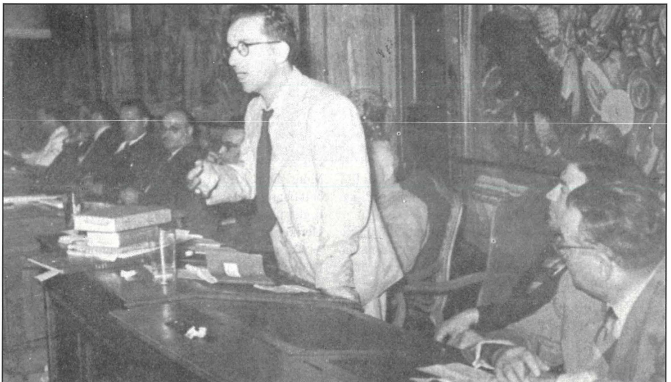
Dom Mintoff, fii-bidu tal-karriera politika tiegħu, jidher qed jindirizza l-Parlament Malti lejn l-ahhar ta' l-erbghinijiet.

Beda t-twaqqif ta' Assemblea Nazzjonali biex tinkiseb