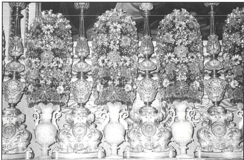
Fjuretti mlewna, mpoġġjin bejn il-gandieri fuq l-altar tas-Salib fir-Rotunda tal-Mosta, għall-jiem tal-festa ta' l-Assunta.

Il-festi reliġjużi li jiġu organizzati f'kull belt u rahal f'dawn il-gżejjer, jagħmlu sehem mill-patrimonju tagħna. Huma dawn il-purċissjonijiet fil-festi li jagħtuna karattru individwali Malti. Il-festa tal-patrun jew patruna, hi l-ikbar manifesstazzjoni mlewna li fiha, darba fis-sena, tispikka fuq kull haġa ohra l-vara għażiża. L-użu tal-vari fil-festi żviluppa u kiber f'dawn l-aħhar erba' mitt sena. Kull vara tiġbed l-ammirazzjoni ta' eluf ta' turisti li jiġu għall-btala tagħhom, l-aktar matul is-sajj meta l-istaġun tal-festi jkun fl-aqwa tiegħu. L-istatwa hija wkoll l-ghożża ta' hutna l-emigranti fl-artijiet imbiegħda. Imma sikwit jiġri li ċerti hwejjeġ aktarx nohduhom 'for granted'. Ghax il-vara ma tikkonsistix fl-istatwa nnifisha biss. Il-pedistall u l-bankun huma parti integrali biex il-vara tkun kompleta kif imdorrijin narawha armata fil-jiem tal-festa. Imma żomm! Jonqos insemmu xi haġa ohra! Qatt tajna każ ta' dawg l-erba' fjuretti tal-ganitill li jkunu ma' kull ġenb tal-pedistall? Jekk le, allura qajla ninteressaw ruhna biex infittxu kif tinhadem din is-sengħa ta' sabar u reqqa liema bhala? Dan ix-xogħol delikat li kien komuni fit-tmintax u d-dsatax-il seklju sa qrib it-tieni Gwerra Dinjija, għandu jgħaġġeb lil min jarah u jisthoqqlu li jkun apprezzat aktar minn kull min għandu għal qalbu l-ġieħ u l-harsien ta' wirt artna.