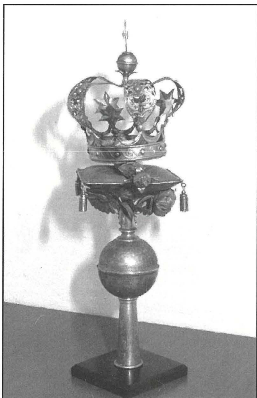
Il-kruċetta ta' l-Istandard Imperjali li kellha s-Soċjetà Nicolò Isouard. Saret madwar mitt sena ilu.

Jidher għalhekk li fl-1925 l-istandardi l-qodma, li semmejna, kellhom jinbidlu u saru l-erba' l-ġodda li jissemew f'dawn id-dokumenti. Fir-ritratt tal-Banda Nicolò Isouard li ttiehed fl-1931, insibu l-istess bandalora li saret fl-1906 u erba' standardi. Dak ta' Malta bl-arma tal-Mosta fuqu, tal-Papa, tal-Madonna bin- Nome di Maria u l-iehor tal-Gran Brittanja . Hija haġa ċerta li dawn l-erba' standardi huma dawk li saru fl-1925. Il-Malti, tal-Papa u tal-Madonna għandhom rispettivament l-istess kruċetti li kienu jintużaw għall-istandardi l-qodma. Dak Ingliż saritlu kruċetta ġdida forma ta' labarda. B'hekk, il-kruċetta ta' l-istandard tar-Re ma ntuzatx aktar. Bhal ta' qabilhom, dawn l-erba' standardi