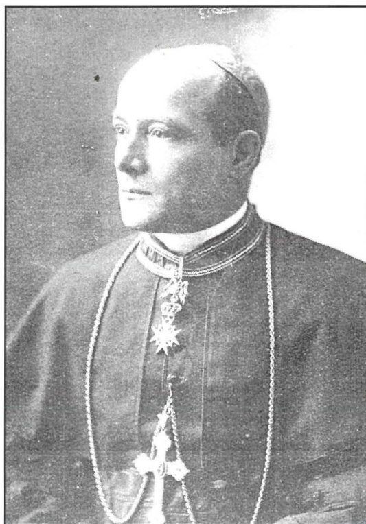
L-Eċċellenza Tiegħu Mons. Dom Mauro Caruana O.S.B., Arċisqof ta' Malta bejn l-1915 u l-1943.

Minn dawn iż-żewġ dokumenti li semmejna johroġ ċar li fl-1925 saru erba' standardi ġodda għall-Banda Nicolò Isouard. Nistgħu niehdu xi tagħrif dwar l-istandardi tas-Soċjetà minn xi ritratti antiki. Fir-ritratti tal-Banda Nicolò Isouard li ttiehdu fl-1911 u fl-1912 u mir-ritratti tal-Kungress Ewkaristiku tal-1913, insibu li mal-banda kien ikun hemm il-Bandalora tas-Soċjetà li saret fl-1906 u