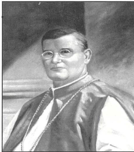
Il-Wisq Reverendu Dun Pawl Mallia, Arcipriet tal-Mosta bejn l-1907 u l-1930.

L-attività komplet bi programm mużikali fil-pjazza tal-knisja li kien jinkludi dawn is-siltiet mużikali: l-Overture 'Poet and Peasant' ta' Suppè,