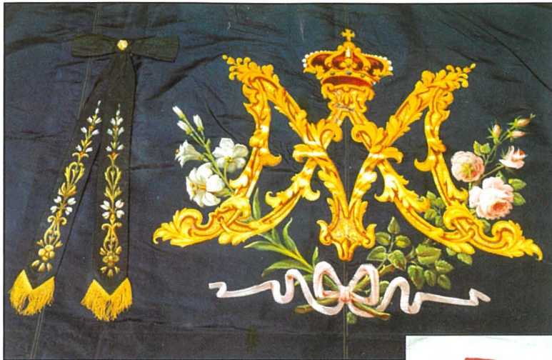
Standard ikhal bin-nome di Maria, li sar fl-1925. Jidher ukoll il-pendent dekorat.