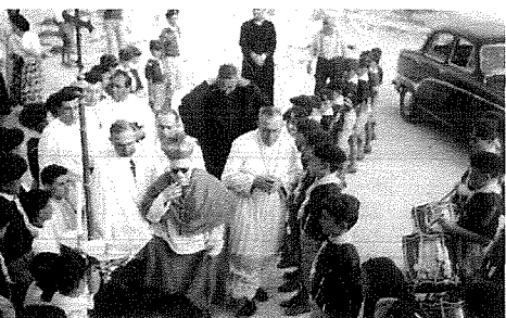
Dakinhar tat-berik tal-Kappella, 25 ta' Lulju 1963.