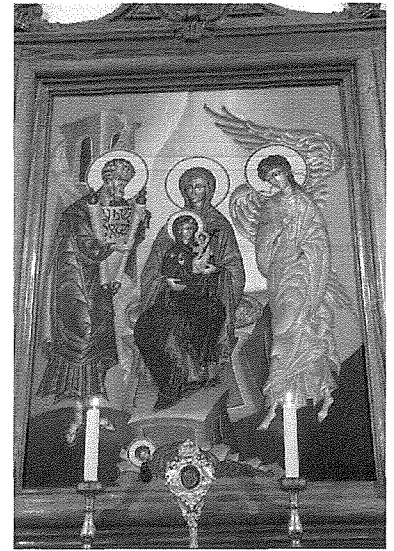
Il-Kwadri Titulari tul l-istorja tal-Kappella ta' Sant'Anna.