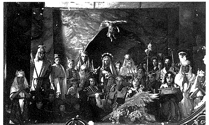
Waqt id-dramm: Il-Grotta ta' Betlehem

Kif rajna aktar qabel meta kkwotajna l-artiklu ta' Għawdex , kienu ħafna dawk li ġew jarawh. Għadni niftakar lin-nanna tgħid li tiftakar sa seba' xarabanks 'ipparkjati' fil-Pjazza. Għalkemm ma sibtha mkien però jingħad ukoll li dan id-dramm inħadem seba' darbiet.