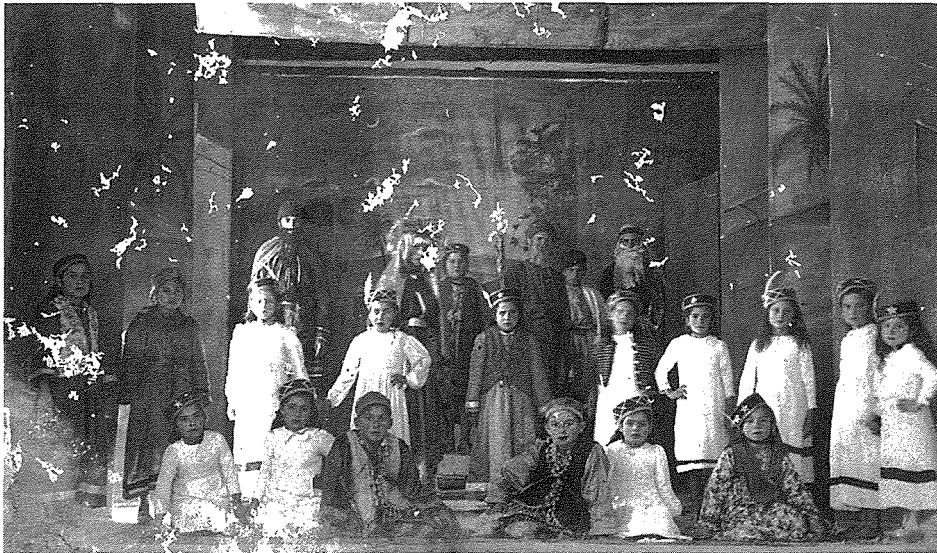
Waqt id-dramm: Il-Ferh tal-Betlehmiti

Iċ-Ċirklu tal-Azzjoni Kattolika u d-dramm reliġjuż, It-Twelid ta' Ġesù Bambin