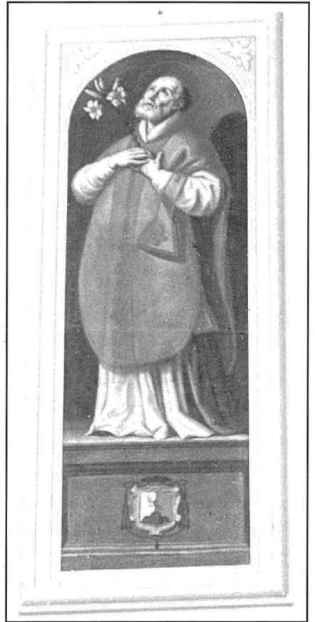
San Lawrenz Martri u San Filippu Neri.