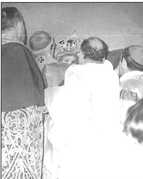
Il-mument sollenni meta l-Arċisqof Gonzi poġġa l-kuruna fuq ras l-Assunta.

Il-festi ta' l-Inkurunazzjoni kellhom gheluq mill-isbah fil-festa ta' Santa Marija, il-Ġimgha