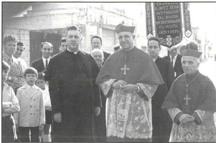
L-Arcipriet B. Bezzina mal-Kardinal Corrado Ursi u l-Isqof E. Galea fil-festi tal-100 sena mill-Konsagrazzjoni tar-Rotunda f'Ottubru 1971.

Interessanti din. Qabel ma hallejt raħal twelidi biex mort Hal Safi, missieri kera d-dar lill-kuġin Pawlu li mar joqgħod fiha u rabba hemm il-familja tiegħu fejn għadha toqgħod sal-lum. Mill-banda l-ohra, ohti Ġuzeppa kienet tghidli: "Kem nixtieq dar hdejn il-Knisja biex ma jkollix bogħod biex immur nisma' l-Quddies." Ġara li s-sidien tad-dar fejn noqgħod illum riedu jbiegħuha. Avviċinawni u staqsewni jekk ridtx nixtriha jien. Jien aċċettajt allavolja kienu joqgħodu n-nies fiha u xtrajt id-dar. Imma r-raġuni prinċipali li għaliha bqajt noqgħod il-Mosta kienet li wara 21 sena li kien ili noqgħod hemm, jiena drajt hafna lill-Mostin u l-Mostin draw lili. Qalbi ntrabtet mal-Mosta u bqajt noqgħod il-Mosta. Fl-10 ta' Awwissu 2000 nagħlaq 40 sena li ili noqgħod il-Mosta!