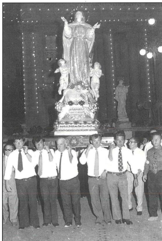
Il-vara ta' Santa Marija merfugħa mill-Familja Vassallo fil-Lejl Marjan fit-2 l'Awwissu 1975.

Malli spiċċat il-Konċelebrazzjoni, għal xi 8.30 pm., hargħet mill-Knisja l-Istatwa ta' Santa Marija akkompanjata mill-Kleru u l-poplu tal-Mosta, biex fost ir-Reċita tar-Rużarju u l-kant ta' l-Innijiet Marjani, titwassal sal-bidu ta' Triq il-Kungress Ewkaristiku, fejn kienu miġbura eluf ta' Maltin li kienu ġew minn diversi