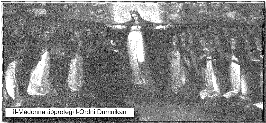
Il-Madonna tiproteġi l-Ordni Dumnikan

L-iktar punt importanti għaliex Santa Katarina hija waħda mill-patrni tal-Ordni huwa l-fatt li Santa Katarina hija patrna tal-filosofi. Dan minħabba li Santa Katarina rnexxielha tiddefendi l-fidi Kristjana qud-