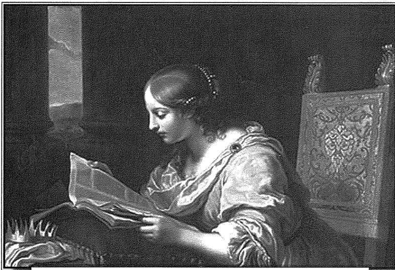
Santa Katarina ta' Lixandra – Patruna tal-filosofi.

Insibu diversi rakkonti oħra speċjalment fuq il-ħajja ta' San Duminku mill-Beata Ċeċilja, soru Dumnikana. F'wiehed mir-rakkonti taghha tgħid li darba wara li San Duminku qatta' lejl sħiħ jittlob fil-Knisja, daħal fid-dormitorju fejn kien hemm ħutu l-patrijiet u fit-tarf l-ieħor tad-dormitorju jara tliet nisa, waħda minnhom bis-satla u fuq in-naħa l-oħra mara li f'idejha kellha l-asperges li mbagħad tagħtu lil dik li kienet fin-nofs. U għaddew min-nofs tal-kamra u l-mara tan-nofs bdiet tbierek lill-patrijiet, imma lil wiehed mill-patrijiet ma berkitux. F'ħin minnhom San Duminku niżel għarkupptej u talab lill-mara tan-nofs bil-herqa biex tgħidlu min hi. F'dak iż-żmien fil-kunventi ta' Ruma l-patrijiet u s-sorijiet ma kinux qegħdin ikantaw is-"Salve Reġina" imma kienu jgħiduha waqt li jkun għarkuppejhom. U l-mara qaltlu, jiena dik li kull filgħaxija tgħidulha, "ejja mela Avukata taghna dawwar lejna dawk l-għajnejn tiegħek tal-ħniena" u f'dak il-ħin jiena nagħmel prostrazzjoni quddiem Ibni Ġesù biex iwettaq dan l-Ordni. Imbagħad San Duminku staqsieha min huma dawk li kienu maghha, u qaltlu li huma Santa Katarina ta' Lixandra u Santa Ċeċilja. San Duminku wkoll staqsieha għalfejn ma berkitx wiehed minn uliedu, u qaltlu li sempliċiment ma jisthoqqlux, u wara komplet tbierek il-kumpliment tal-patrijiet.