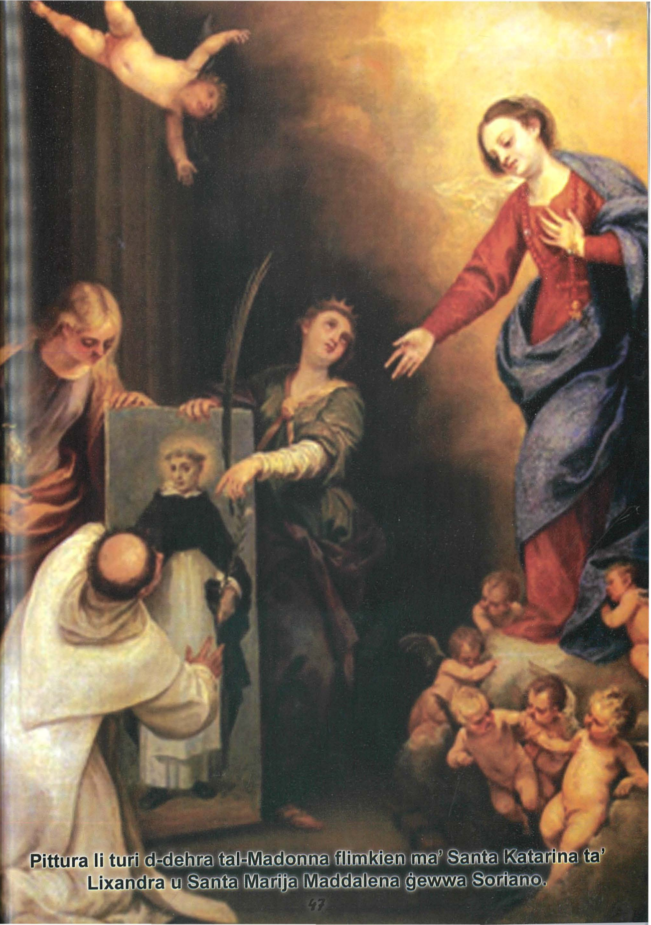
Pittura li turi d-dehra tal-Madonna flimkien ma' Santa Katarina ta' Lixandra u Santa Marija Maddalena gewwa Soriano.