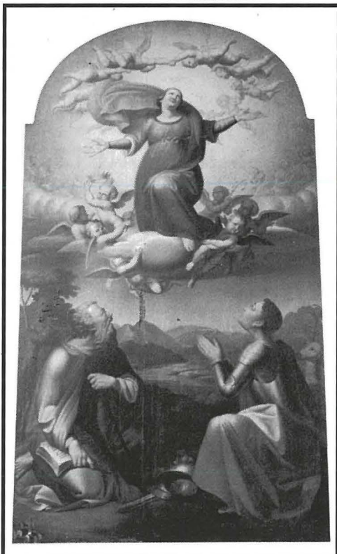
Il-Kwadru tal-Assunzjoni ta' Santa Marija b' San Pawl u San Ġiljan, żejt fuq tila u xoghol Antonio Falzon fl-1855, li jinsab fis-Sagrastija tal-Knisja ta' Lapsi f' San Ġiljan

Fi żminijiet iktar qrib tagħna nsibu l-figura ta' Marija Assunta mqiegħda bi prominenzja fuq qniepen oħra notevoli, fosthom il-qanpiena l-kbira tal-Kolleġġjata u Bażilika ta' San Ġorġ Megalomatri fil-Belt Victoria